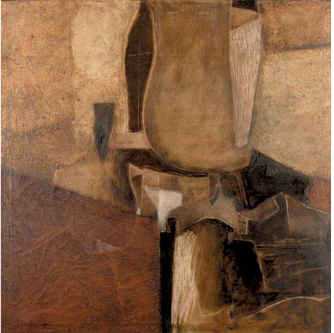
Iglesia 2000 óleo/tela 100 x 100 cm.