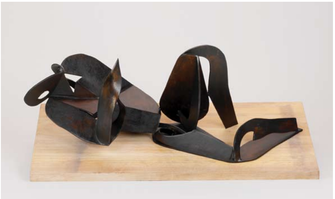
Adán sin costilla 2005 chapa de hierro 35 x 80 x 40 cm.