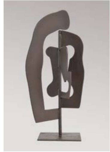
Eco del reflejo 2010 chapa de hierro 32 x 18 x 18 cm