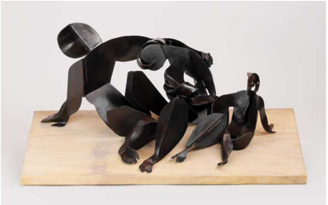
Mi familia 2005 chapa de hierro 40 x 80 x 40 cm.