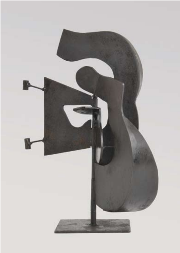
Nido 2010 chapa de hierro 29 x 18 x 18 cm.