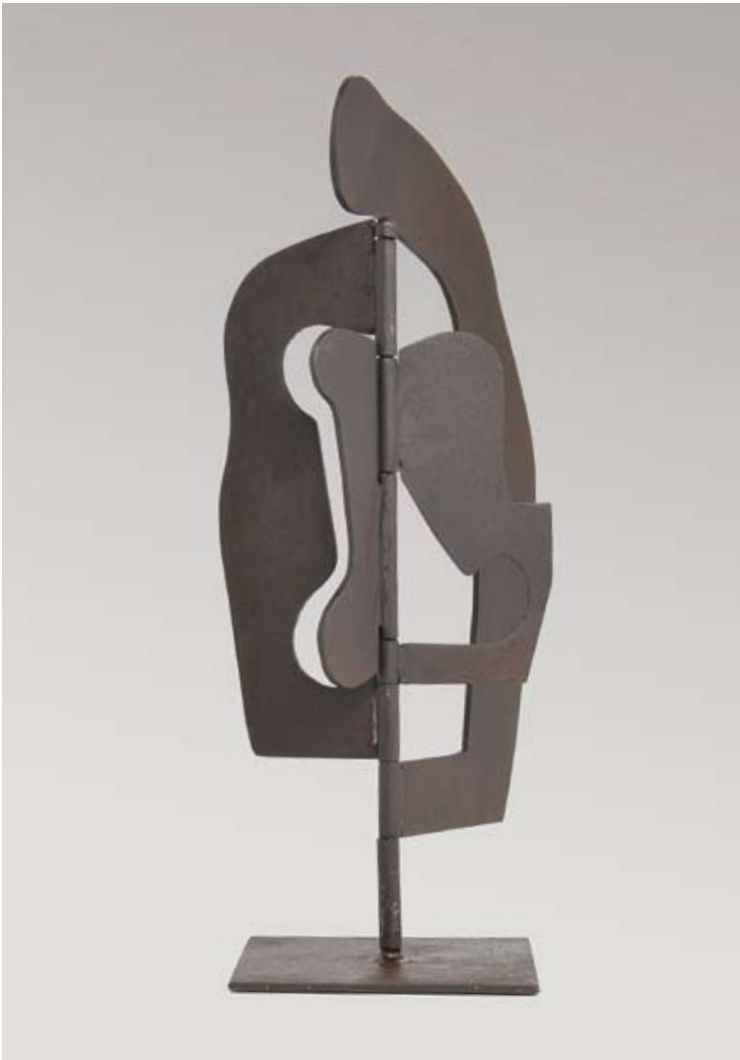
Espiral 2009 chapa de hierro 55 x 55 x 55 cm.