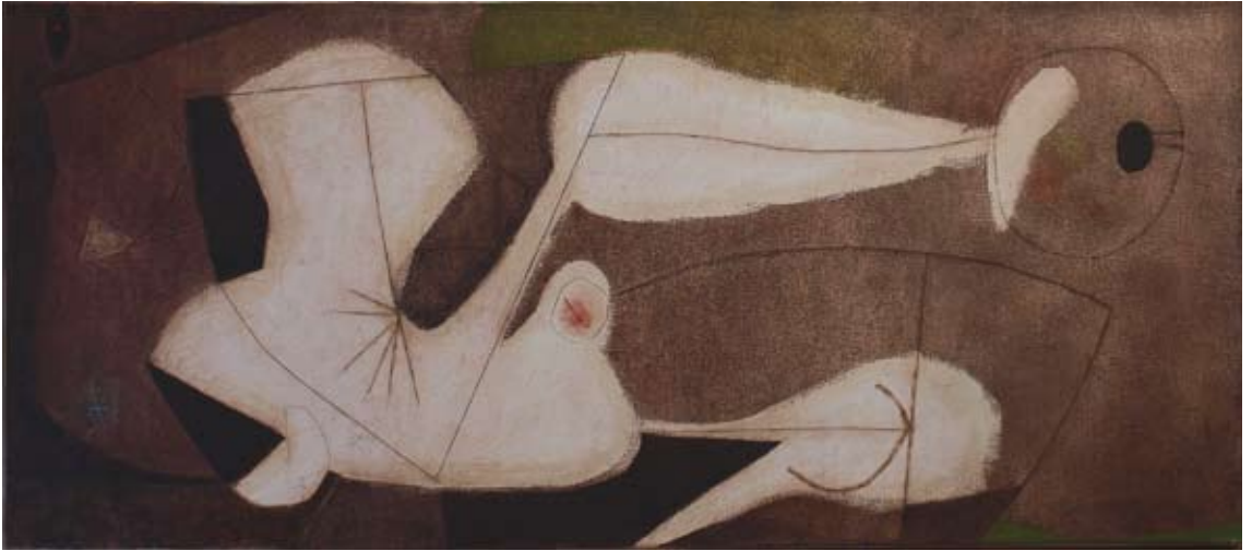
Vítima 2002 óleo/tela 65 x 146 cm.