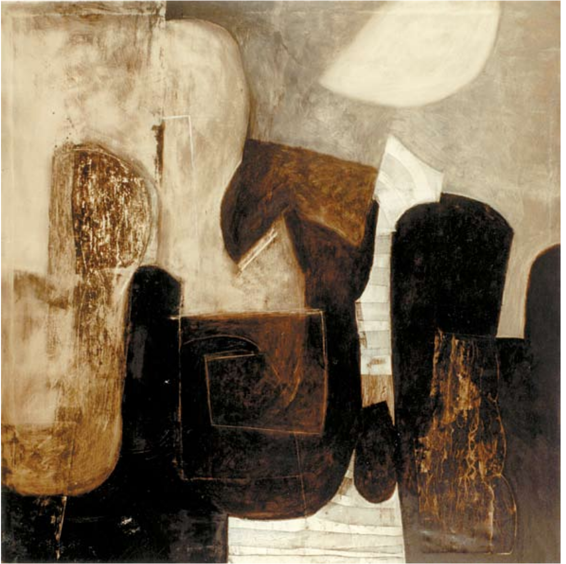
Cuarto menguante 2000 óleo/tela 150 x 150 cm.