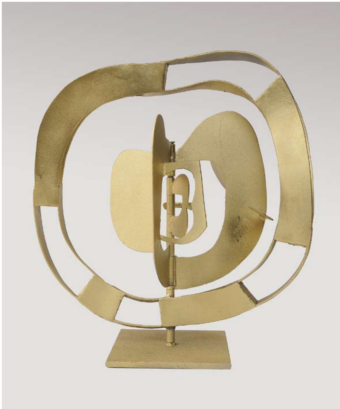
Dorada manzana del Sol 2010 chapa de hierro pintada 50 x 50 x 50 cm.